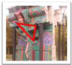
귀공포(좌)와 추녀(우)의 구고현의 정리